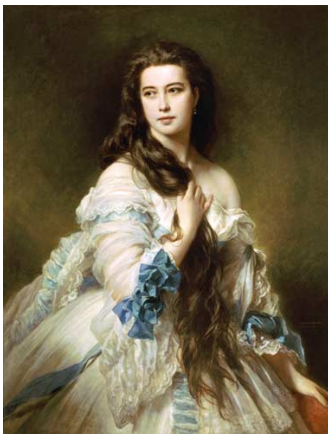
Franz Xaver Winterhalter. Madame Rimski-Korsakov , 1864. Musée d'Orsay.

Nadejda joua un rôle de premier plan dans la vie sociale du couple, se montrant particulièrement active lors des soirées musicales, aussi bien en tant qu'accompagnatrice qu'interprète. Moussorgski, qui l'aimait beaucoup, et dont elle était proche, l'appelait « notre cher orchestre ».